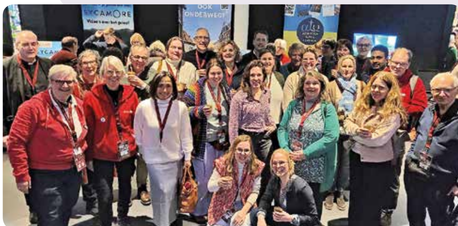
Een aantal van onze parochianen bij de Conferentie Missionaire Parochie.