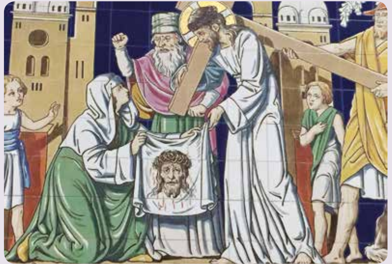
6 e kruiswegstatie Sint Jankerk